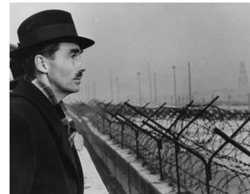
1965, Berliner Mauer