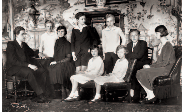
1930er Jahre, die acht Geschwister mit Königin Zita