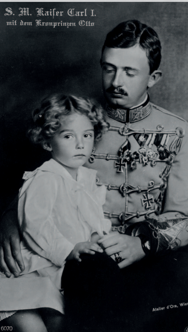
1917, Karl I. mit Kronprinz Otto