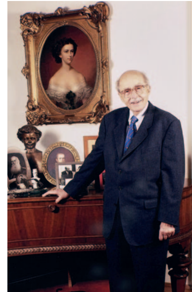
um 2000, Pöcking